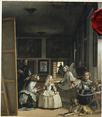
Arquitectura Barroca.

El historiador alemán Heinrich Wölfflin (1864- 1945) identifico en el año 1888, al barroco como oponente del renacimiento y como una clase o tipo de arte diferente dentro del arte “elaborado”.